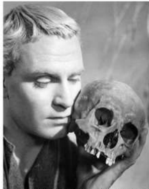
Figura 2. O Hamlet , de Shakespeare, não pode ser identificado a nenhum particular concreto, como ao texto ou aos eventos que ocorrem na peça teatral, uma vez que sua existência depende continuamente da imaginação daqueles que entram em contato com ele.