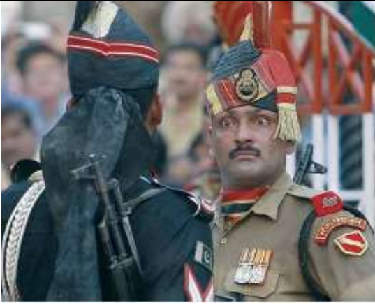
Militares do Paquistão e da Índia, frente a frente, na fronteira entre os dois países.

Um fator responsável pelos enfrentamentos entre Índia e Paquistão é o seguinte: