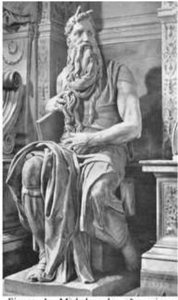
Figura 1: Michelangelo não criou uma escultura de Moisés, ele descobriu uma figura escultural num bloco de mármore e a revelou ao mundo por meio de seu talento.

Observe a gravura abaixo e leia suas informações.