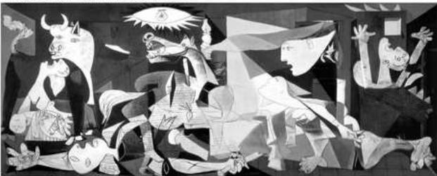
Figura 3. É impossível apreciar Guernica , de Picasso, por meio de reproduções, simplesmente porque elas não são a pintura que está exposta no Museu Rainha Sofia.

As legendas das três figuras refletem diferentes posicionamentos em Filosofia da Arte, diretamente relacionados a questões: