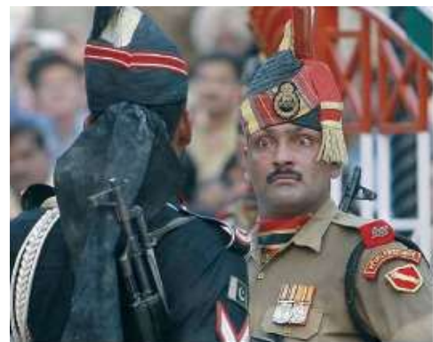
Militares do Paquistão e da Índia, frente a frente, na fronteira entre os dois países.

JORNAL DO BRASIL, 12 jun. 1998 (Adaptação).