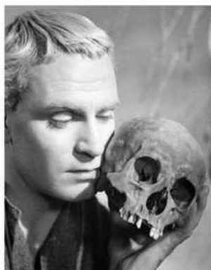
Figura 2: O Hamlet, de Shakespeare, não pode ser identificado a nenhum particular concreto, como ao texto ou aos eventos que ocorrem na peça teatral, uma vez que sua existência depende continuamente da imaginação daqueles que entram em contato com ele.