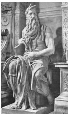
Figura 1: Michelangelo não criou uma escultura de Moisés, ele descobriu uma figura escultural num bloco de mármore e a revelou ao mundo por meio de seu talento.

Observe a gravura abaixo e leia suas informações.