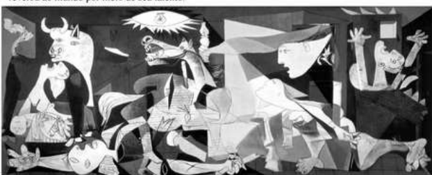
Figura 3: É impossível apreciar Guernica, de Picasso, por meio de reproduções, simplesmente porque elas não são a pintura que está exposta no Museu Rainha Sofia.

As legendas das três figuras refletem diferentes posicionamentos em Filosofia da Arte, diretamente relacionados a questões: